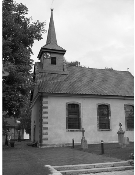
St. Michael Wehmingen