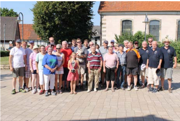
Text F. Reinicke

Selbstverständlich wurde auch für das leibliche Wohl der Teilnehmer und Besucher mit Gegrilltem, Salaten, leckerem Kuchen und diversengut gekühlten Getränken gesorgt. Die hierfür erlösten Spenden werden, wie auch bisher, für die vielseitigen Aktivitäten unserer Stiftung eingesetzt.