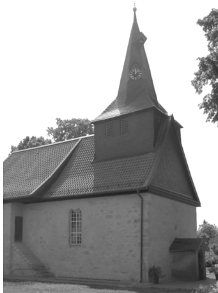
St. Nicolai Bolzum

der ev.-luth. Kirchengemeinden Bolzum und Wehmingen