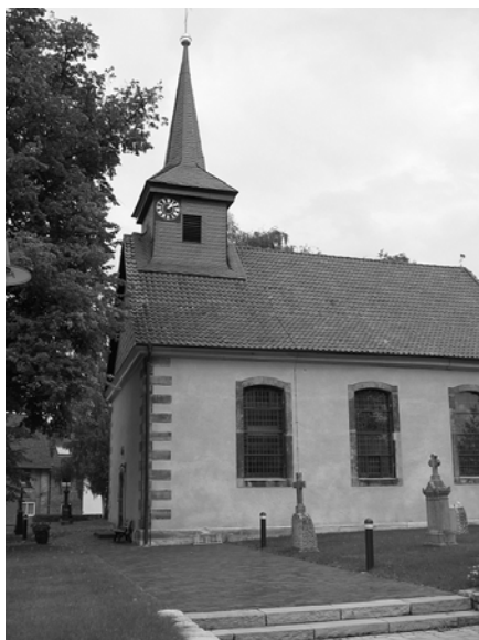
St. Michael Wehmingen