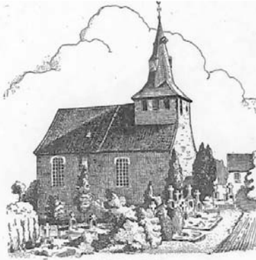
Kirche in Bolzum.